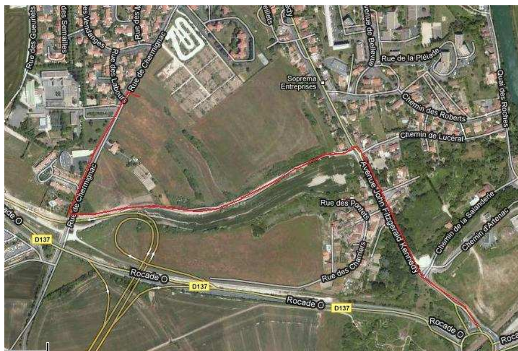
— Itinéraire d'accès à la piste à partir du rond point de Diconche (route de Pons). rond point de diconche

La piste est situé rue de Chermignac 17100 Saintes (à côté de la gendarmerie)